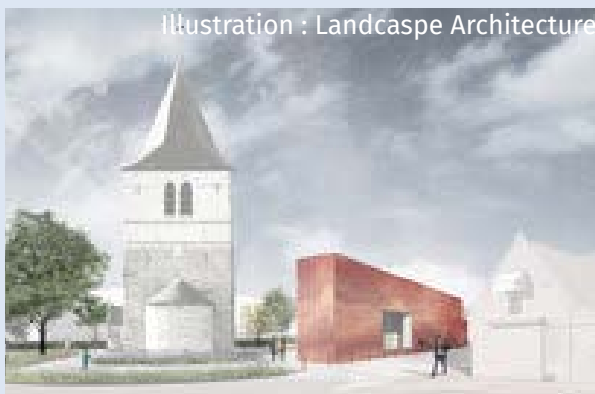
Illustration : Landcaspe Architecture