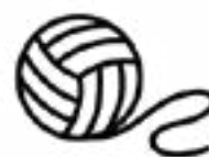
DE LA FICELLE

SANS OUBLIER LES GRAINES « MÉLANGE DE GRAINES POUR LES OISEAUX DE LA NATURE »