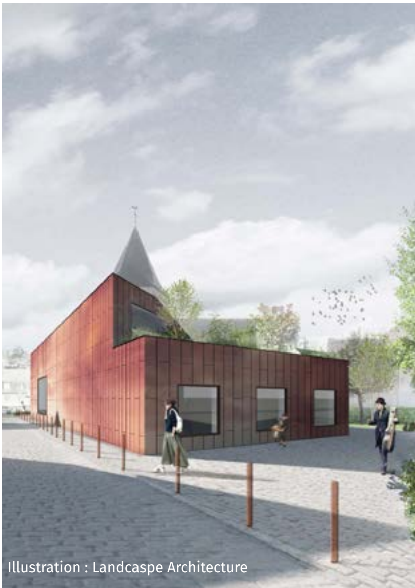
Illustration : Landcaspe Architecture