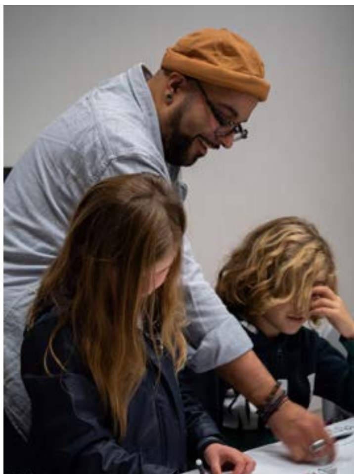
Goum lors du Salon