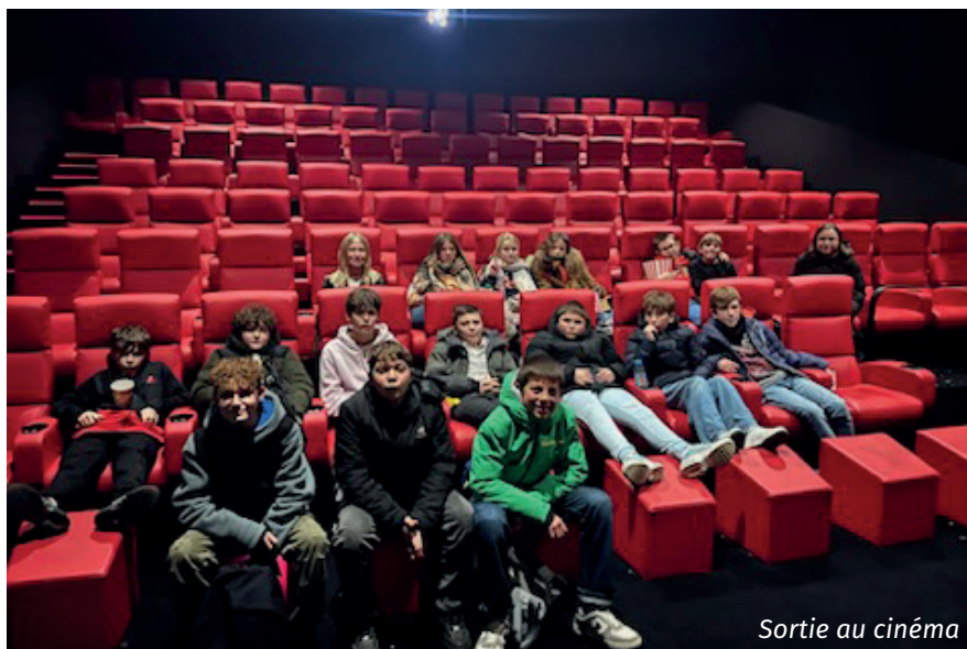
Sortie au cinéma