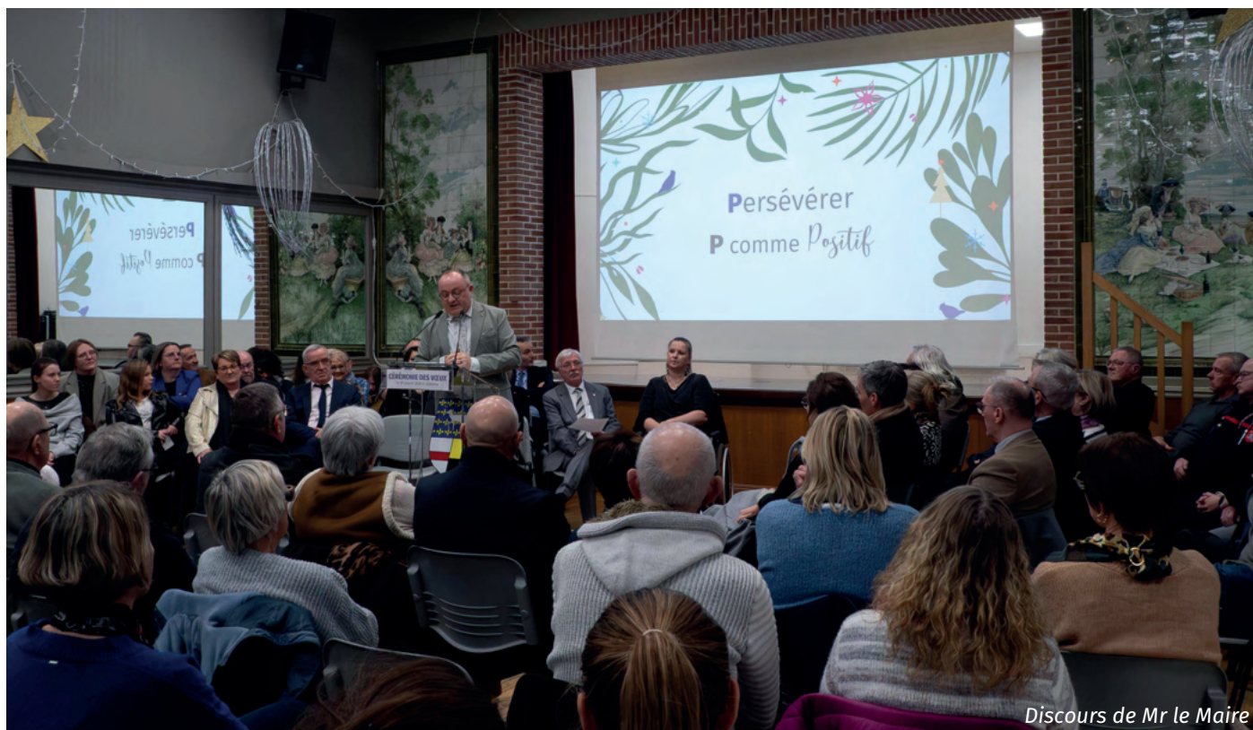
Discours de Mr le Maire

À l'occasion de la nouvelle année 2026, Monsieur le Maire et le conseil municipal ont présenté leurs vœux à la population lors d'une cérémonie conviviale et chaleureuse.