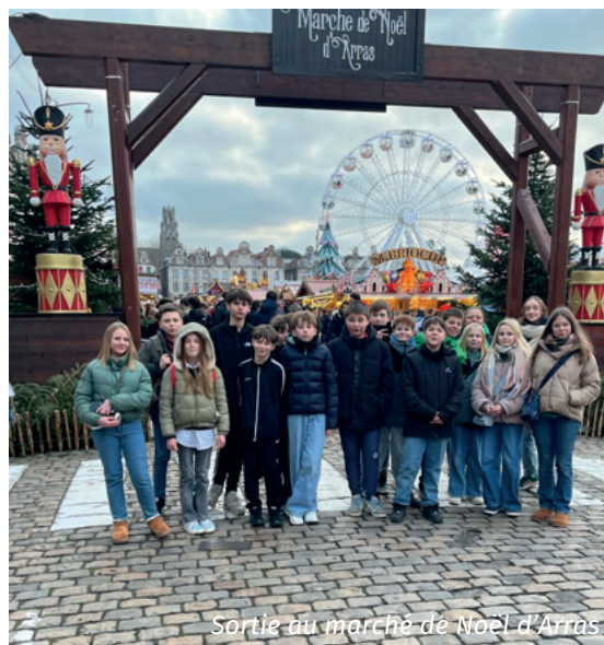
Sortie au marché de Noël d'Arras