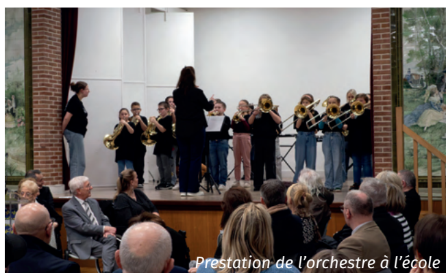
Prestation de l'orchestre à l'école

La cérémonie s'est ouverte avec la prestation de l' Orchestre à l'école . Musiciens depuis la rentrée de septembre 2024, les élèves de l'école élémentaire ont impressionné le public par leur talent, leur sérieux et leur motivation. Un grand bravo à eux ainsi qu'aux professeurs de l'école municipale de musique qui les accompagnent chaque semaine dans ce beau projet pédagogique.