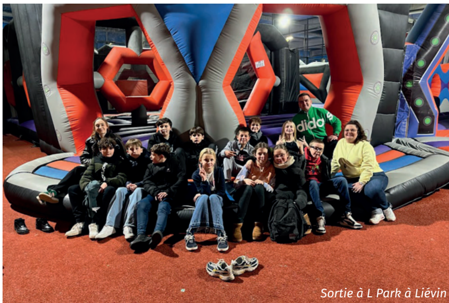
Sortie à L Park à Liévin